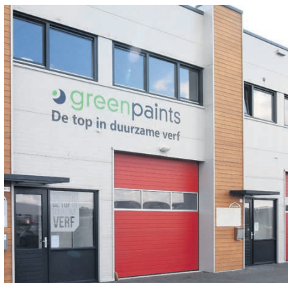
Het exterieur van Waanders' vergroothandel in Goor