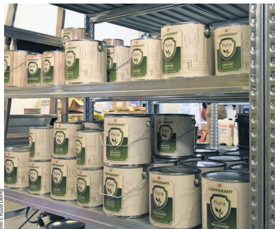
Greenpaints staat vooral bekend om zijn 'groene' en biobased assortiment